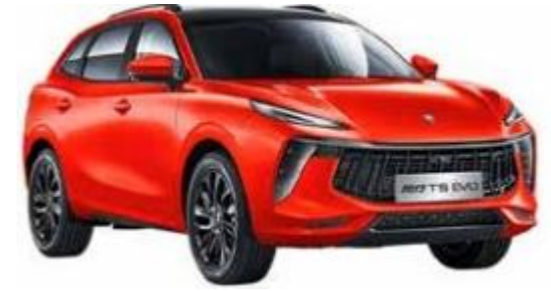
Piros (fekete tető)