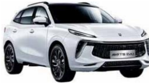
Fehér (fekete tető)