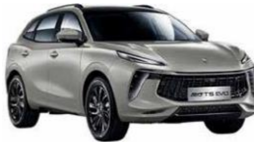
Ezüst (Fekete tető)