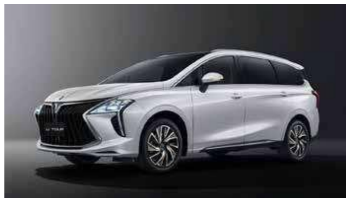
Fehér (fekete tető)