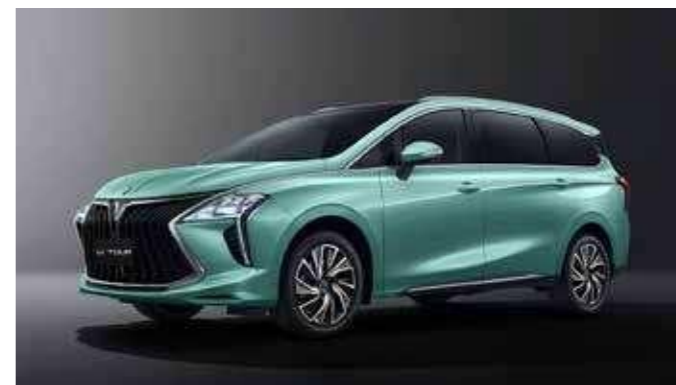
Mentazöld (Fekete tető)