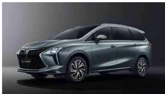
Szürke (Fekete tető)